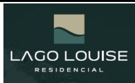
TABELA DE VENDA SETEMBRO/2024